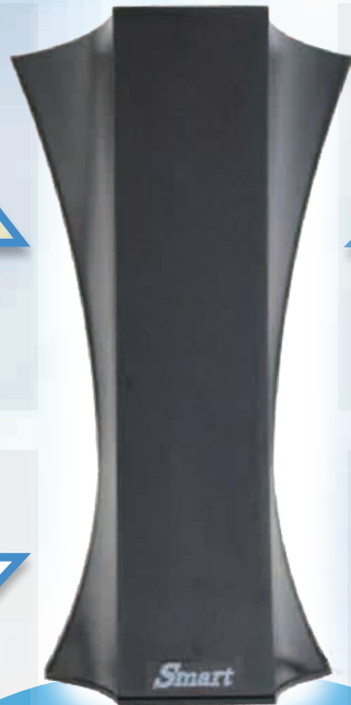
粘着式捕虫器 ムシポンSmart